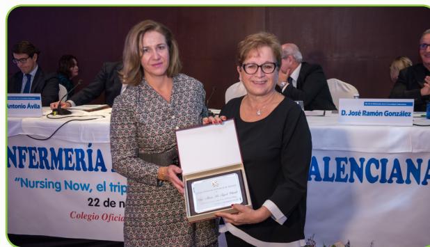
Momento del reconocimiento a los compañeros que cumplieron 50 años de colegiación en 2019