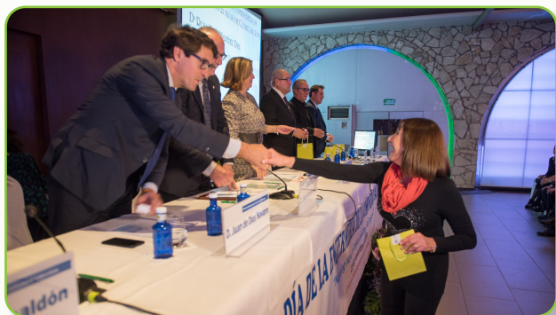
Imagen del reconocimiento a los compañeros que cumplieron 25 años de colegiación en 2019

Sin duda, un apartado muy emotivo y merecido para quienes lo reciben.